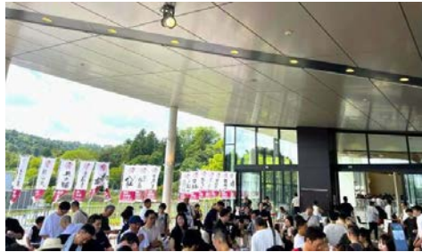
「第9回仙台日本酒フェスト」2023.9 酒のかわしま様

東北を中心とした23蔵元が集結し、約400名のお客様に約100種類の日本酒をお試しいてもらうイベント。日本酒好きの皆さんは、新たな発見や出会い、蔵元との交流を楽しみました