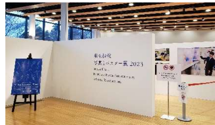
「羽生結弦写真とポスター展2023」 2023.3

イベントスペースに展示用の什器を設置し、回遊性のある展示となり、18日間で15,000人が来場する人気となりました