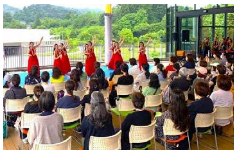
「ハワイアンイベント」2023.7