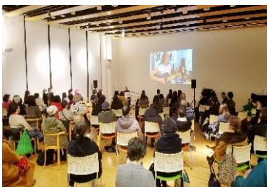
ピーターバラカン氏 「DJトークイベント」 2020.12

仏欄西倶楽部北仙台文化部様主催 ワインを飲みながら、フランス音楽・映画 評論家 永瀧達治さんのトークとシャンソ ンを楽しむイベント