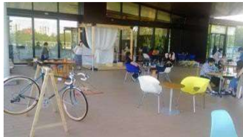
「登米の木であいもん」 2019.5 登米町森林組合様 登米の木の小物と触れ合うイベント