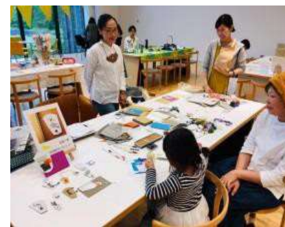
「プレジャーマーケット」 都市デザインワークス主催 切り紙のワークショップ

(株)プレステージジャパン様主催 新作家具のBtoB向け展示会 高さのある天井から照明器具を吊り下げ、ゾーニングし空間演出をすることで、プロダクトの魅力を引き出す展示となりました