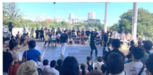
「BLUE CUP」2023.4 総合格闘技やヨガ、パルクール、オーガニックマルシェなどの複合的スポーツイベント