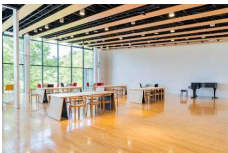
貸出スペース：屋内イベントスペース