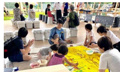
「仙台ロフト第3回つながる市by無印良品」 2019.7 個性派ぞろいのマルシェ