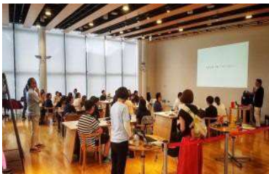
「保育士さん向けセミナー」 (一社)ラーニングジャーニー様 2019

モーニングセッション用の朝食と昼食を ビュッフェ形式でご用意 カフェ・モーツアルト・メトロが提供