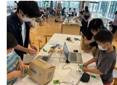
「ロボサバ」 2023.2 つくる・学ぶ・競う3つの体験を軸に、子どもたちのクリエイティブな力を育む総合プロジェクト