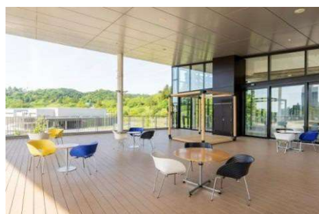
貸出スペース：大屋根付きの屋外テラスと芝生広場