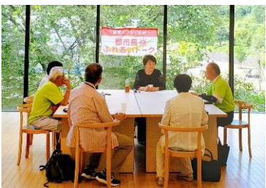
「市長と市民との懇談会 ～郡市長とふれあいトーク～」 2023.7 仙台市市民局広聴課様

モーニングセッション用の朝食と昼食を ビュッフェ形式でご用意 カフェ・モーツアルト・メトロが提供